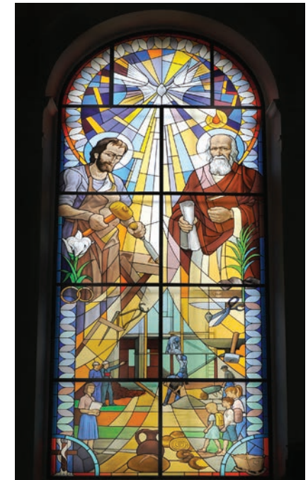
Okno sv. Jožefa in sv. Matija. Avtor: Marcos Luis Jerman. Zanj so darovali žirovski obrtniki in podjetniki, Združenje malega gospodarstva Žiri, Območna obrtno podjetniška zbornica Škofja Loka in Občina Žiri.

Na desni je upodobljen sv. Matija , trinajsti apostol, izbran kot zamenjava za Judo Iškarijota. Ognjeni plamen nad njegovo glavo spominja, da je bil med dvanajsterimi, ki so na binkoštni dan prejeli Svetega Duha. Znamenji apostolskega poklica pa sta knjiga in zvitek Božje besede v njegovih rokah. Palma mučeništva in kamni govorijo o njegovi mučeniški smrti. Sv. Matija je zavetnik gradbenih delavcev, mesarjev (nož), krojačev (škarje), kovačev (kladivo) in slaščičarjev (pecivo) ter mladih na začetku šolanja. Je tudi priprošnjik za plodnost, ki jo simbolizira zibel v spodnjem desnem kotu.