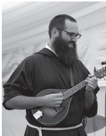
misijonar Luka Modic