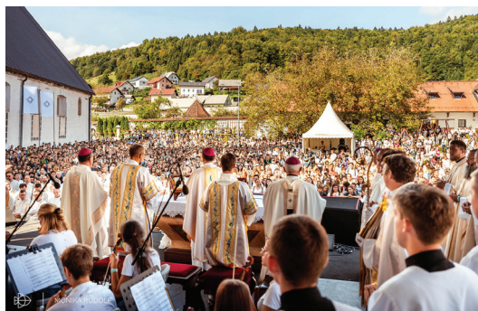
Stična mladih 2023 - Kdo sem?