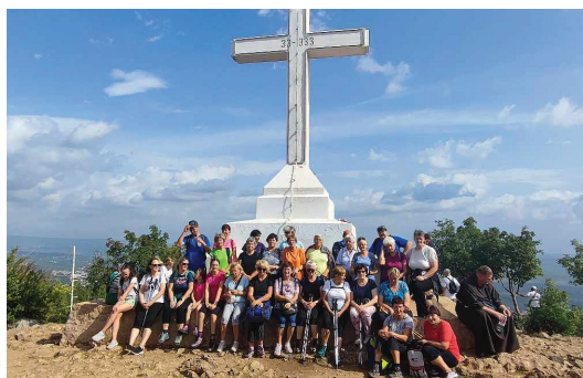
Župnijsko romanje v Medžugorje