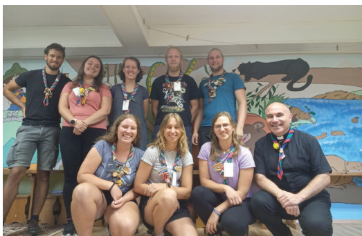
SKVO načrtujejo novo skavtsko leto.