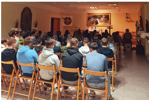
Mladi v adoraciji pred Jezusom