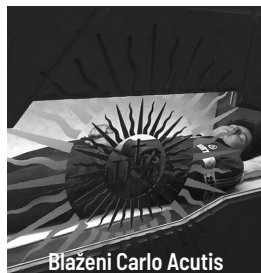
Blaženi Carlo Acutis