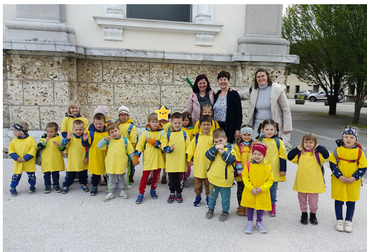
Otroci iz Vrtca pri Sveti Ani na Brezjah