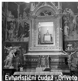
Evharistični čudež - Oriveto