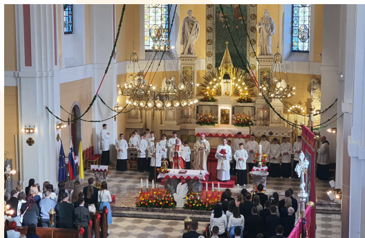
Praznik sv. birme