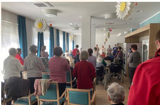
Velika noč v domu SeneCura