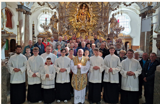
Župnijsko romanje na Bavarsko