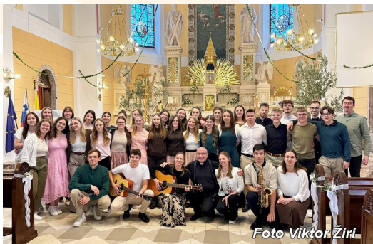
Zaključni koncert MPZ Tvoj glas