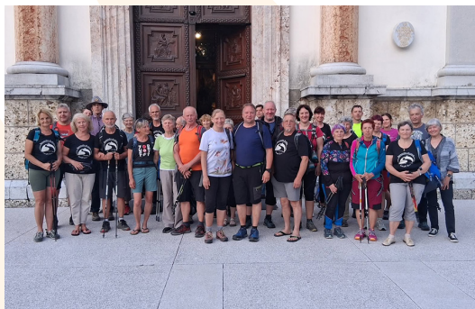
Člani društva ŠmaR peš poromali na Brezje