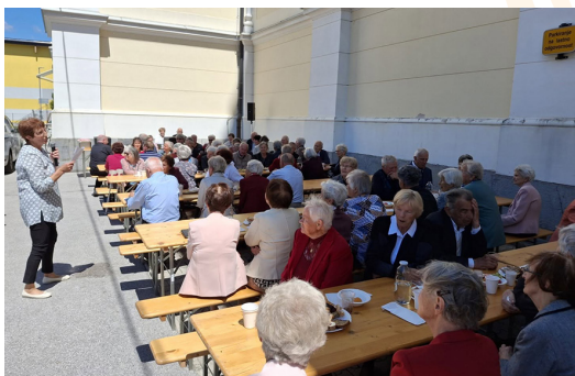
Srečanje upokojencev župnije Žiri