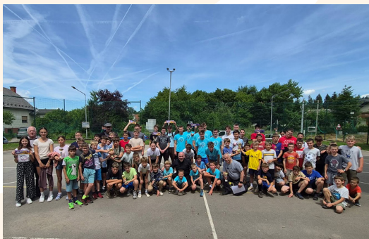
Srečanje ministrantov Dekanije Škofja Loka