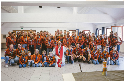
Skavti ob zaključku leta