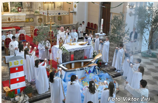
Prvo sveto obhajilo