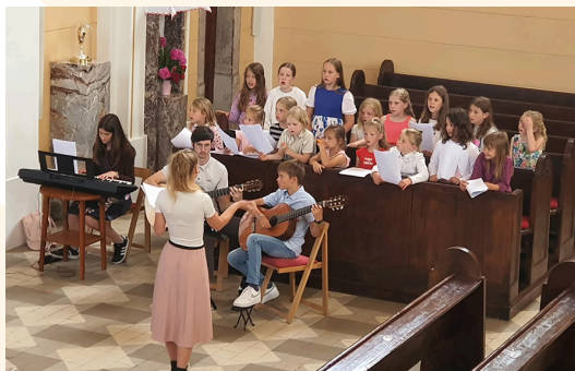
Otroški zbor ob zaključku veroučnega leta