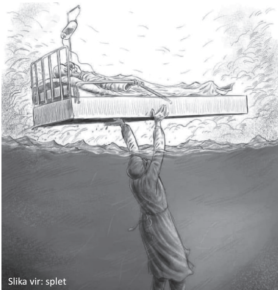
Slika vir: splet