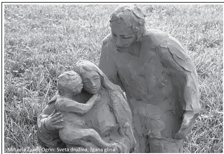
Mihaela Zakelj Ogrin: Sveta družina, žgana glina